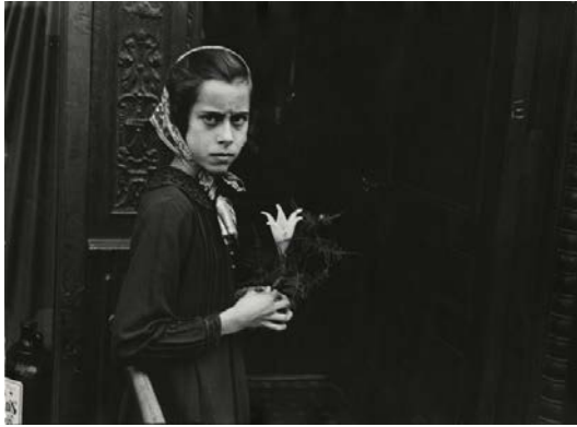
Helen Levitt, N.Y., 1942