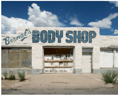
Stephen Shore, Gallup, New Mexico, July 11, 2014, 2015

du très beau « Penumbra » dans les années 1990. C'est raté, on n'a pas pu accéder à l'exposition de ces photographies faites par l'artiste portugais avec Stéphane Duroy. Leica Camera qui l'organisait ouvrait l'espace à ses seuls invités le soir de l'inauguration pour un cocktail. Elle sera toutefois accessible les jours d'ouverture au public.