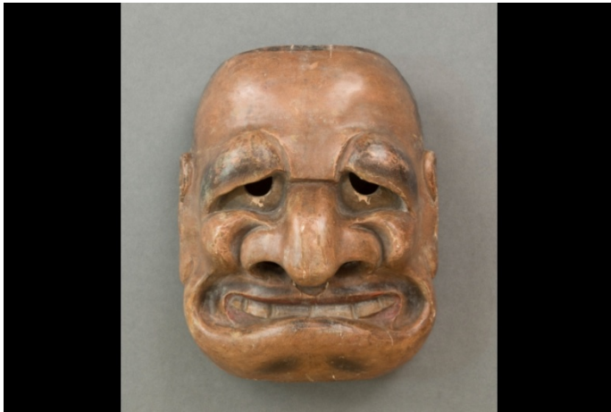
Masque de théâtre, période d'Edo (Japon). - VILLE DE TOULOUSE -