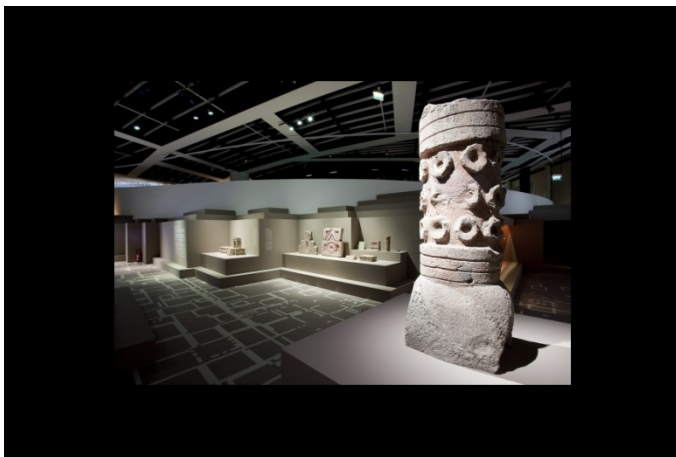
"Best of" Exposition temporaire la plus populaire du musée du quai Branly: "Teotihuacan, cité des Dieux" en 2009.