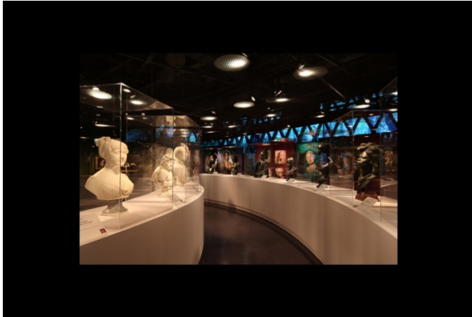
"Best of". Exposition anthropologique : "Cheveux chéris : Frivolité et trophées" en 2012-2013.