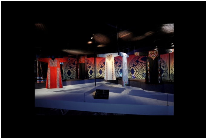
"Best of". Exposition dossier : "L'Orient des femmes vu par Christian Lacroix" en 2011.