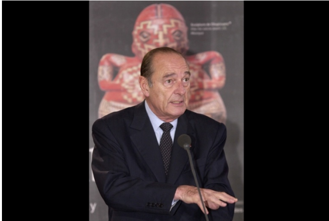
Inauguration présidentielle du musée par le président de la République Jacques Chirac. 20 juin 2006.