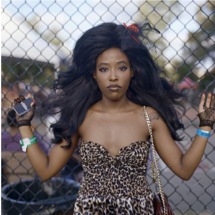
Jungle fever, série We American Flavor, 2012-2014