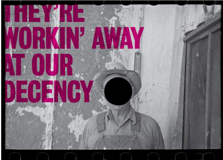
Sans titre, série The dawn came, but no day, 2016

L'Italienne Paola de Pietri photographie des femmes tenant leur nourrisson dans les bras, personnes rendues aussi vivantes que fragiles au devant d'un paysage immobile, espace public inanimé.