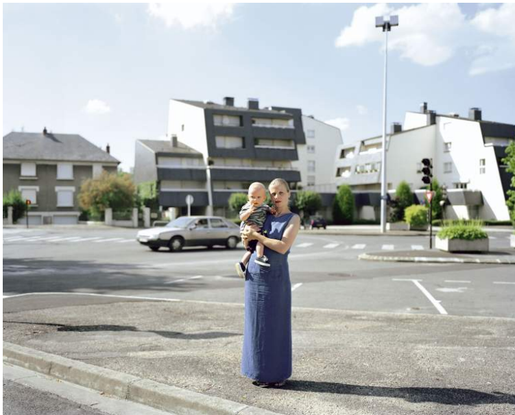
Sans titre, série Here Again, 2003

Elle est représentée par la galerie Les Filles du calvaire (Paris).