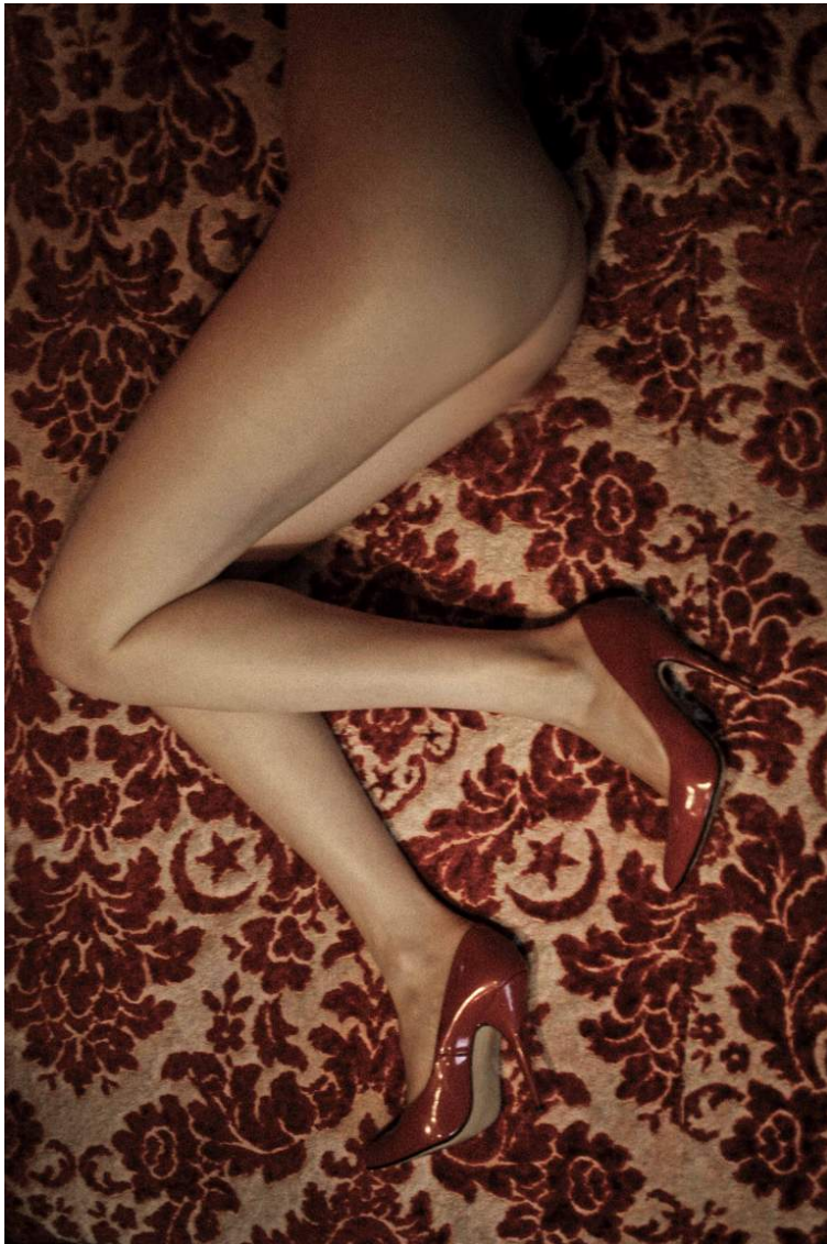
Nu au tapis damassé, Tanger, série Milo, 2013

Nicolas Comment, photographe et auteur-compositeur français, tente de capturer depuis six ans le corps de sa muse et amante Milo. Des photographies érotisées prises aux quatre coins du monde.