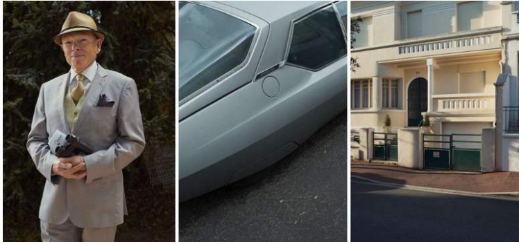
Série Days in Vichy, 2015-2016