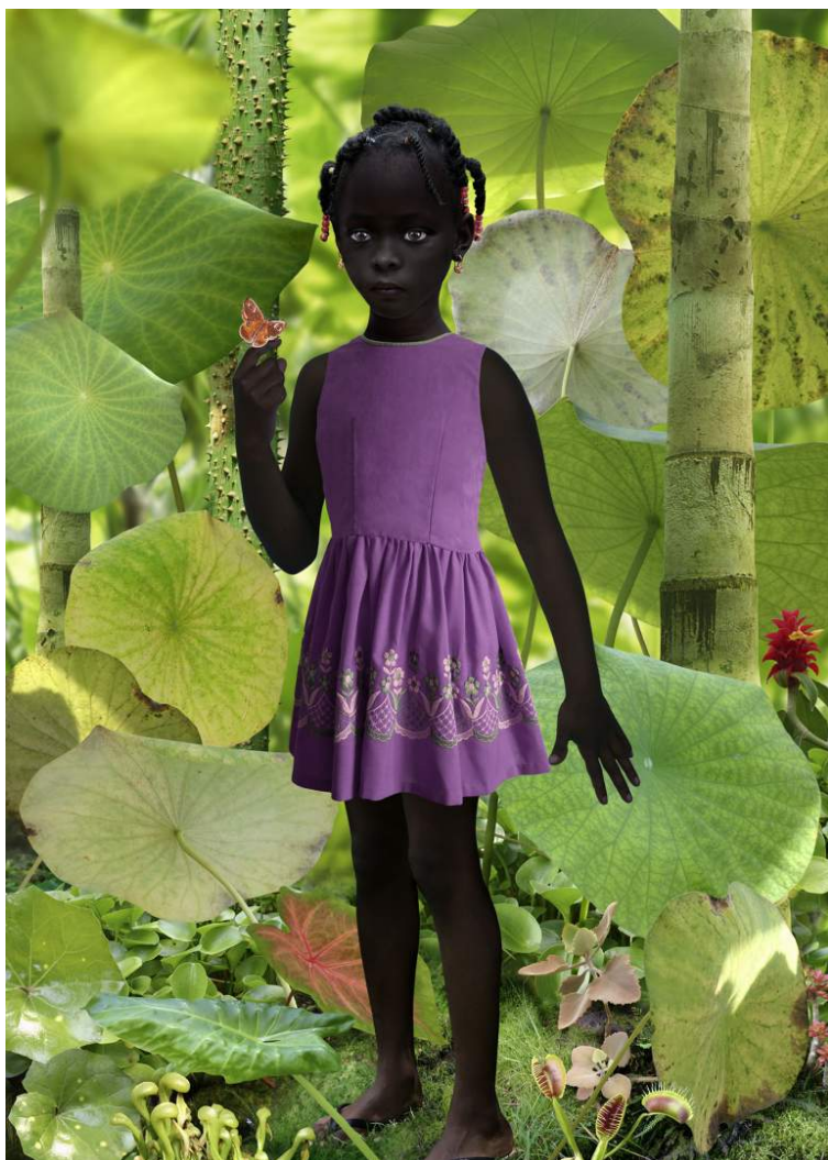
World #11, 2005