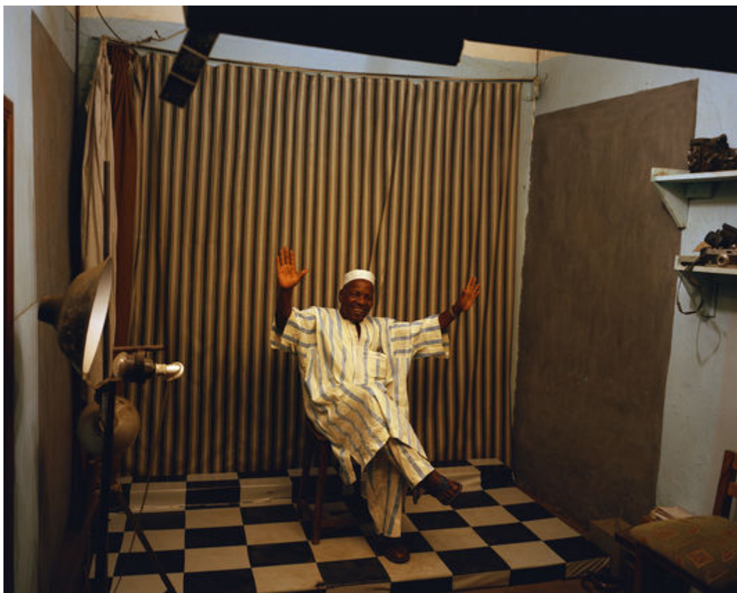
Malick Sidibé, à Bamako, en 2009.

Pour le Malien Seydou Keita, photographe de studio mort en 2001, l'exposition qui s'est achevée le 11 juillet au Grand Palais est une consécration. Et un symbole : c'est ici, en 1906, qu'a eu lieu l'Exposition coloniale. Un siècle plus tard, ses portraits, de près de deux mètres de haut, d'habitants endimanchés d'un Bamako disparu sont affichés sur les murs. La créatrice de mode et collectionneuse agnès B. a été une fan de la première heure, intégrant ses images dans sa collection et sa galerie : « Il y a une telle dignité, un tel respect dans les images de Keita. Il va chercher l'âme des gens. Je le mets au même niveau que Cartier-Bresson. »