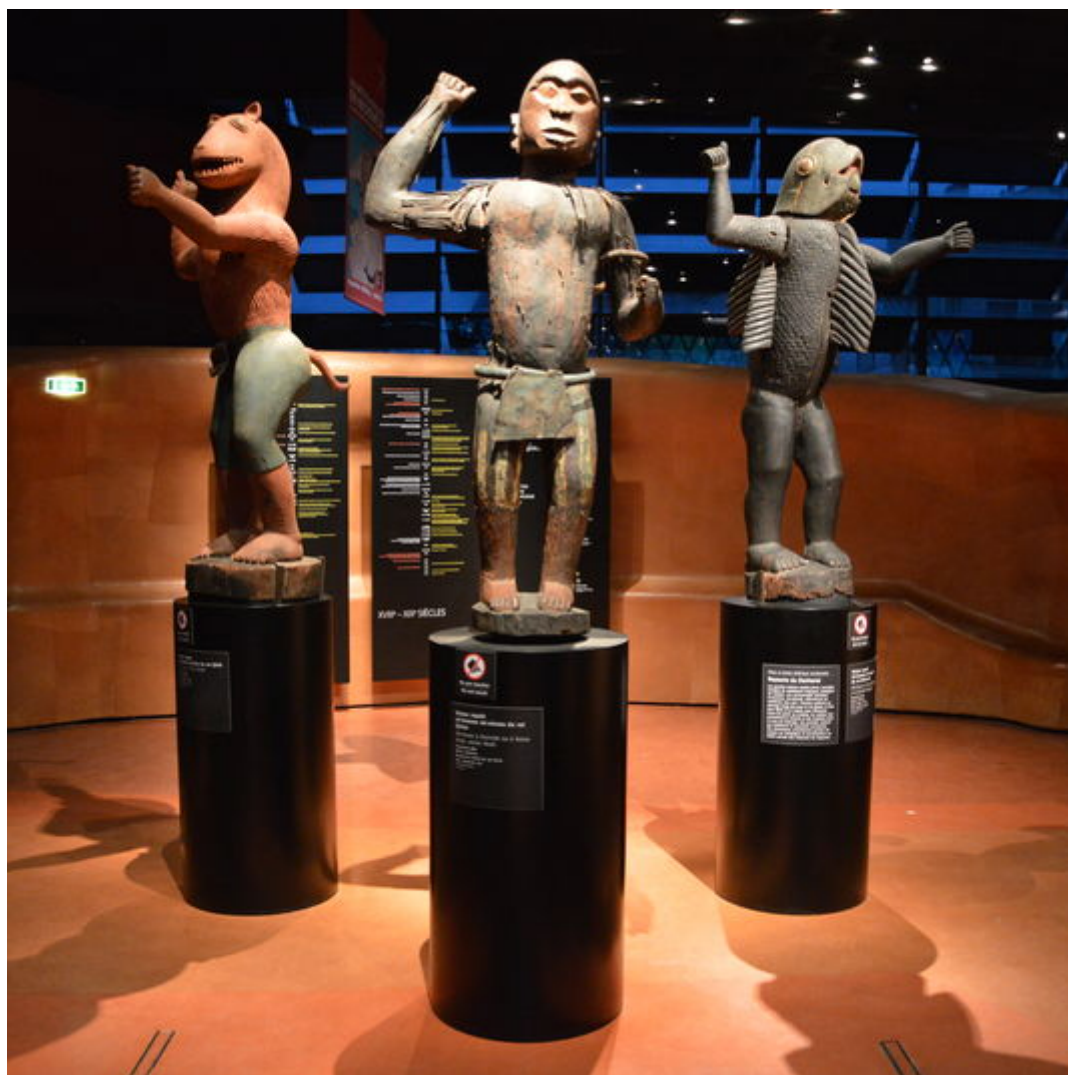
Statues royales, Abomey, Musée du quai Branly, Paris.

Un jour de 2009 qu'il était d'humeur plus grandiloquente que d'habitude, l'ex-président sénégalais Abdoulaye Wade a décidé d'ériger à Dakar un Musée des civilisations noires. Le bâtiment, financé et construit par la Chine, est terminé depuis des mois. S'il n'a pas encore été inauguré, c'est que personne ne sait que mettre à l'intérieur : 90 % des pièces majeures d'art africain classique se trouvant hors d'Afrique.