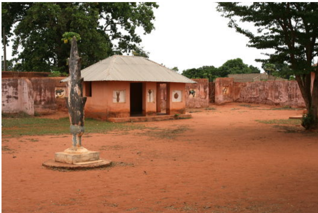
Musée d'Abomey au Bénin.

Urbain Hadonou se lamente. « On a eu jusqu'à 30 000 visiteurs par an. Maintenant, à cause d'Ebola, à cause de la géopolitique, à cause des djihadistes, ce n'est plus que le tiers. »