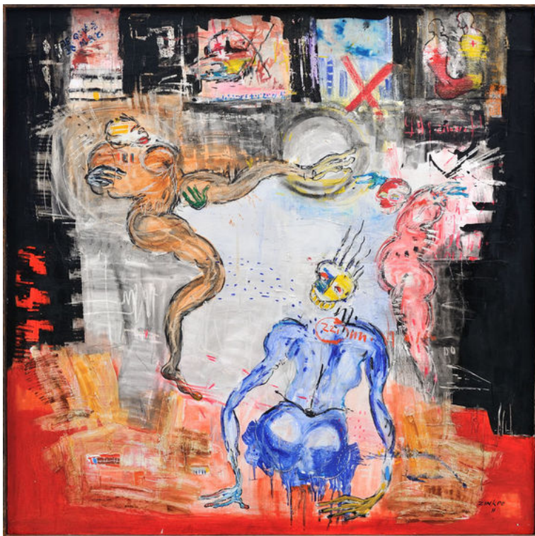
Dominique Zinké "Cotonou by night"

http://www.huffingtonpost.fr/jerome-stern/marche-de-lart-voici-lafrique-contemporaine_b_11390438.html