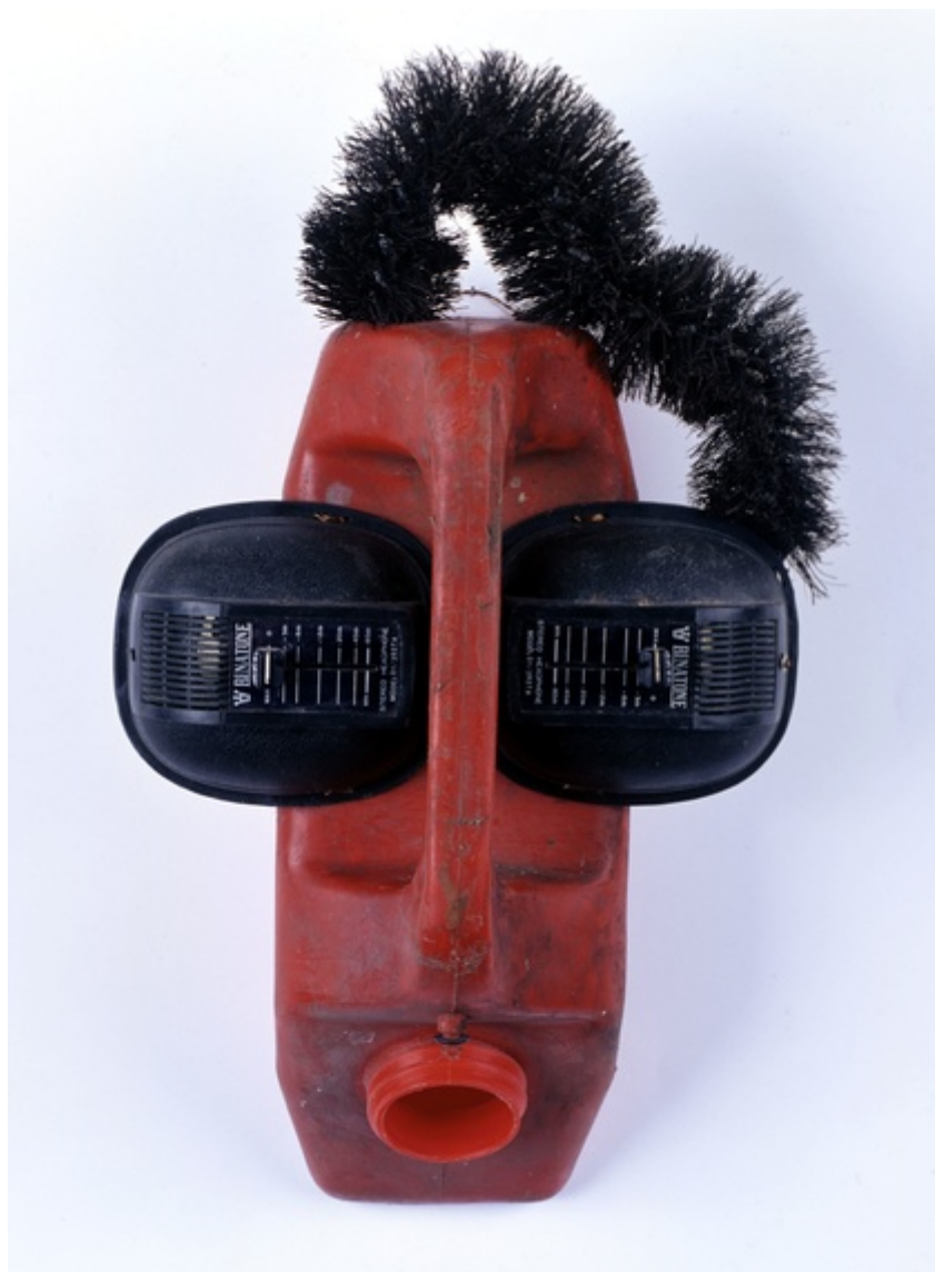
Romuald Hazoumè "Masque, récupération de bidon"