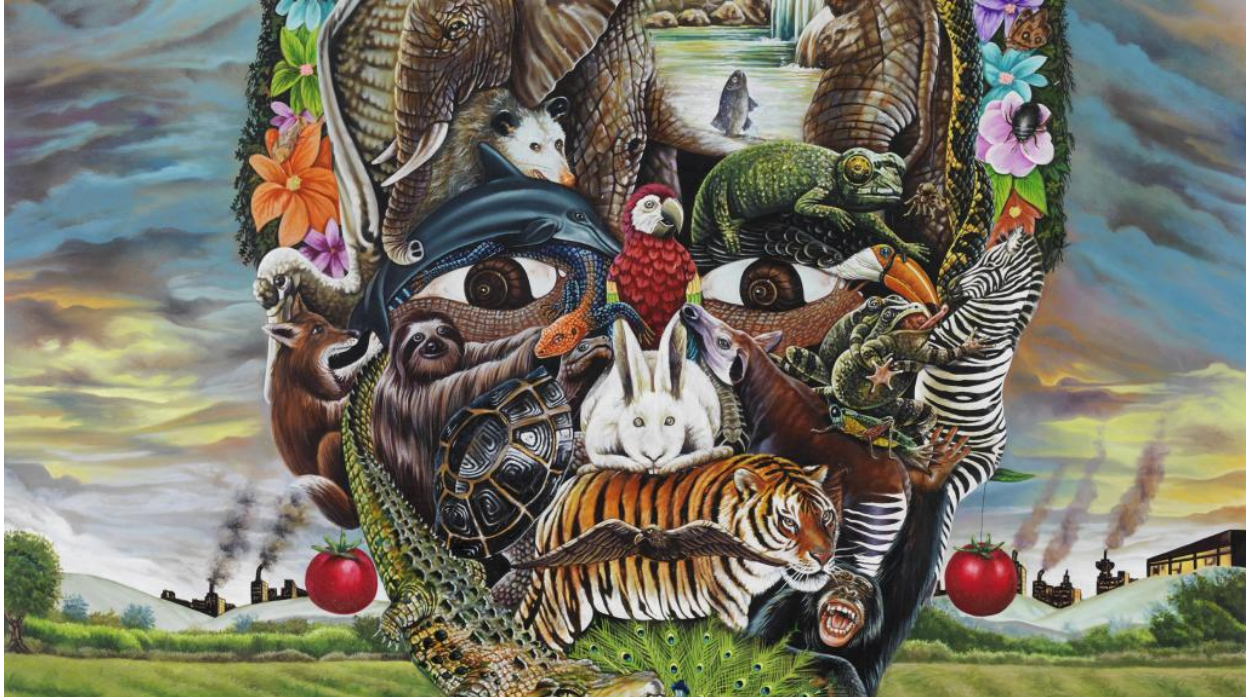
Le tableau, Les bruits de la nature, de l'artiste JP Mika originaire de RDC. © JP Mika

Par Thomas Bourdeau Publié le 27-09-2016