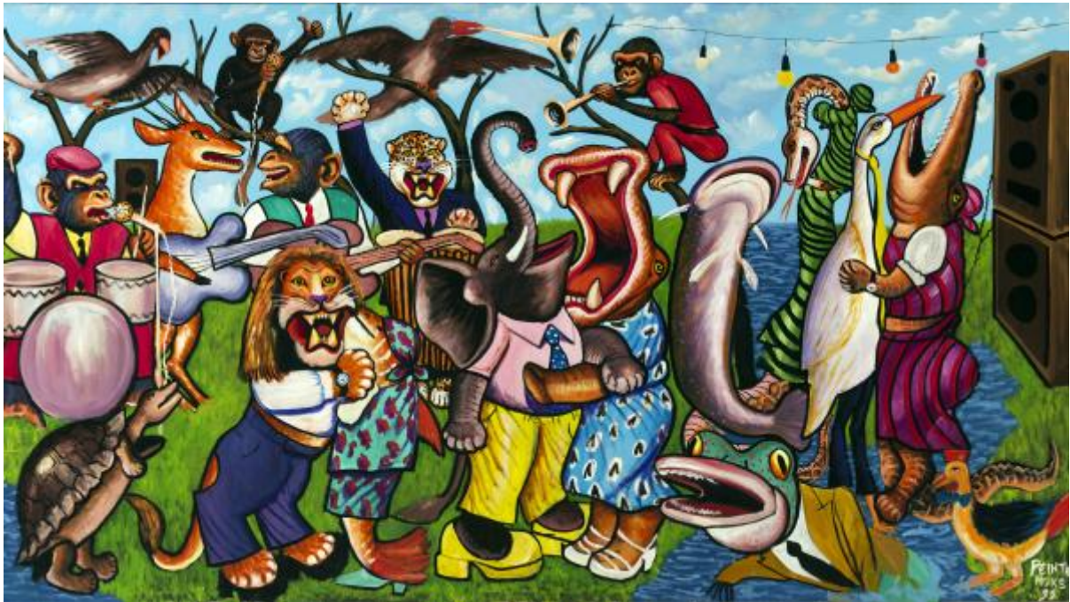
© Moke, l'orchestre dans la forêt... © Moke