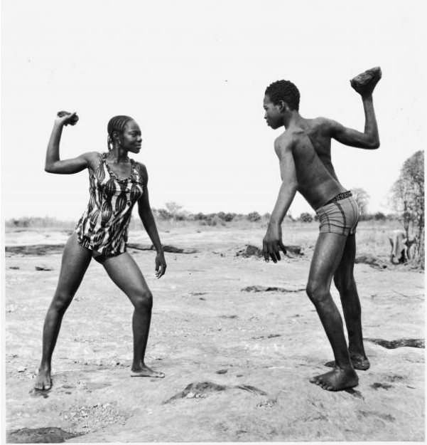
Malick Sidibé : « Combat des amis avec pierres », 1976. Tirage gélatino-argentique. 99 x 99,5 cm. Collection Fondation Cartier pour l'art contemporain, Paris.