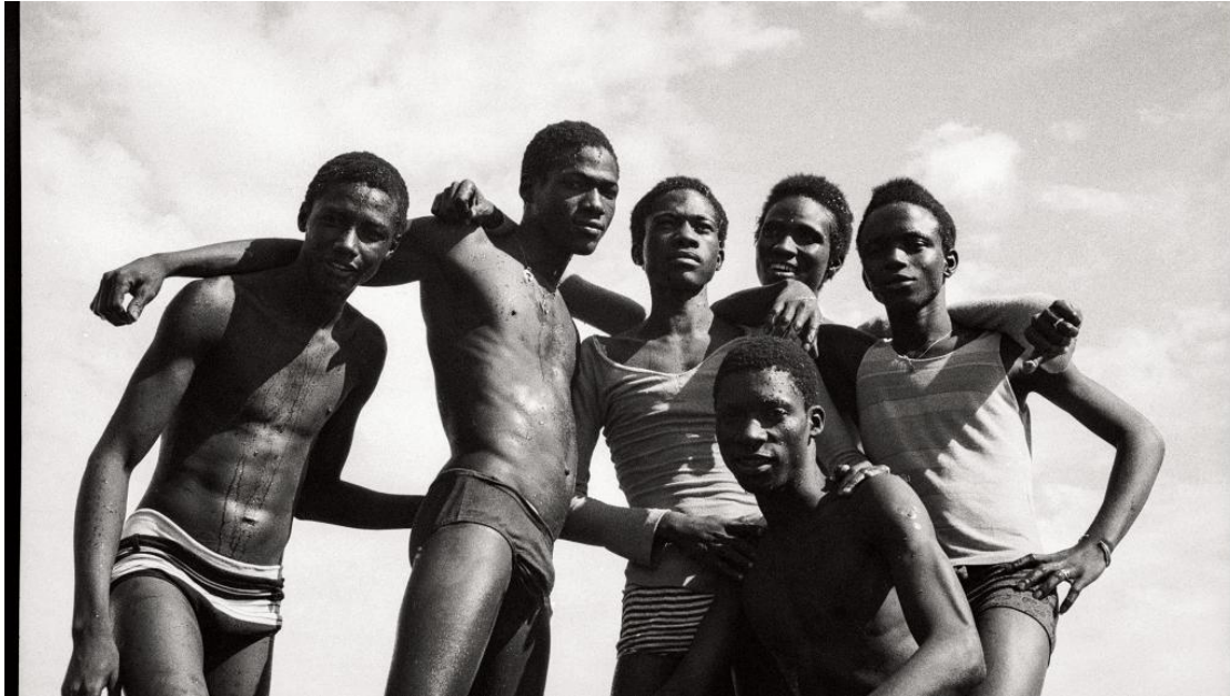
Malick Sidibé : « A la plage » (1974). Tirage gélatino-argentique. 51 x 61 cm.

C'était le « reporter de la jeunesse » à Bamako dans les années 1960-70. Un an après le décès de « l'œil de », la Fondation Cartier à Paris consacre une grande rétrospective à Malick Sidibé. L'exposition « Mali Twist » rassemble quelques 250 de ses clichés. À voir en musique jusqu'au 25 février.