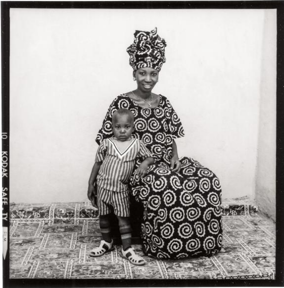
Malick Sidibé, 1973. Tirage gélatino-argentique. 50 x 60 cm.