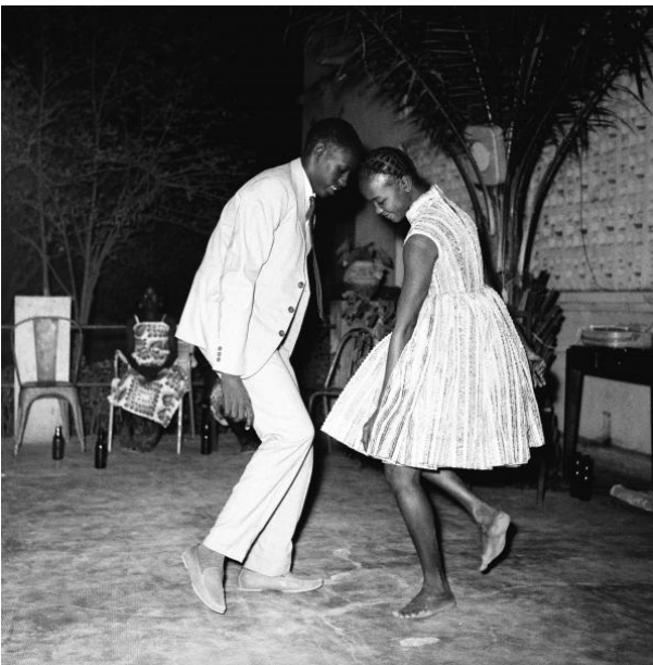
« Nuit de Noël » (Happy Club), 1963. Tirage gélatino-argentique. 100,5 x 100 cm. Collection Fondation Cartier pour l'art contemporain, Paris.