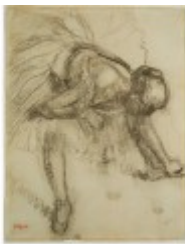
Étude d'une danseuse, vers 1890?, Edgar Degas (1834-1917), fusain. Collection particulière.