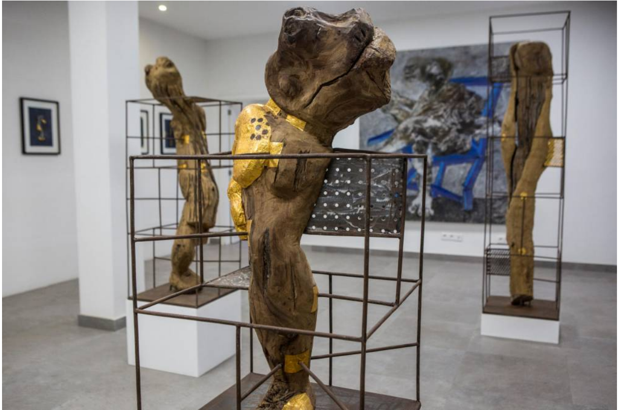
Les travaux de Vincent Michéa et de Sadikou Oukpedjo à la galerie Cécile Fakhoury lors de la 13e Biennale d'art contemporain de Dakar le 4 mai 2018.