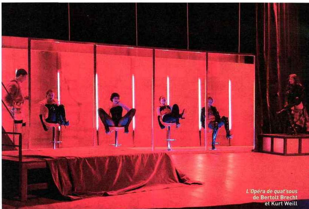
L'Opéra de quat'sous de Bertolt Brecht et Kurt Weill

festival jusqu'au 23 août, Bussang, theatredupeuple.com