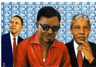
1. «Uma Moziki», 1960, de Jean Depara. 2 Sans titre de Pili Pili Mulongoy. 3. «Oui, il faut réfléchir», 2014, de Chéri Samba.