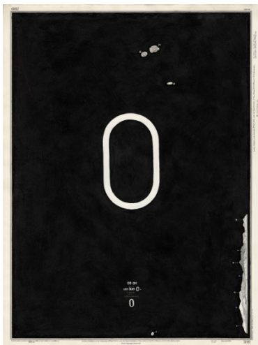
Philippe Favier, Les îles O , 2014.

Du temps, il en fait aussi à l'éditeur Bernard Chauveau pour peaufiner ses éditions rares à quelques exemplaires avec des artistes aussi sollicités que Giuseppe Penone, star de l'Arte Povera, qui vient là avec une transcription musicale de la structure des arbres, ou encore celle, un grand tissu bleu pétant aux mots cousus, de l'artiste hipster américain, Lawrence Weiner, considéré comme l'un des chefs de file de l'art conceptuel. Le stand de 8+4 fait là une parfaite impression avec une triptyque énigmatique et voyageur de l'artiste français, Philippe Favier, qu'il serait bon de revoir plus souvent, et ses grandes cartes baléares, noircies et rehaussées de dessins et tissages, ou encore avec les blanches empreintes de feuilles de chêne agrandies, en relief, du duo Anne et Patrick Poirier. En parfaits jardinier délicats.