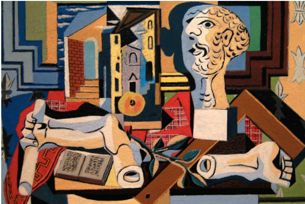
Peinture cubiste de Picasso, qui sera exposée à Rabat.

Du 19 avril au 31 juillet 2017, le musée Mohammed VI d'art moderne et d'art contemporain de Rabat (Maroc) présente « Face à Picasso », la toute première exposition marocaine consacrée au maître du XXe siècle. Réunissant plus de cent œuvres : tableaux, sculptures, céramiques, photographies, dessins et estampes issues des collections du Musée national Picasso-Paris, l'exposition revient sur le thème de l'artiste et son modèle, véritable fil rouge de l'iconographie picassienne. Le parcours, qui se déploie en onze sections chrono-thématiques, est avant tout un panorama pluridisciplinaire de l'œuvre de Pablo Picasso.