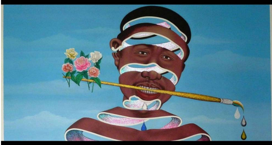
Chéri Samba, J'aime la couleur , 2003, Collection de la Fondation Louis Vuitton. © Chéri Samba : photographe : Claude Germain, Primaie

La Fondation Vuitton accueille du 26 avril au 28 août trois expositions consacrées à la création artistique actuelle du continent africain. Avec un large choix d'œuvres de la collection d'art africain de Jean Pigozzi (1989-2009) intitulé « Les Initiés », un focus sur la scène contemporaine de l'Afrique du Sud et enfin un aperçu de la collection africaine de la Fondation Vuitton.