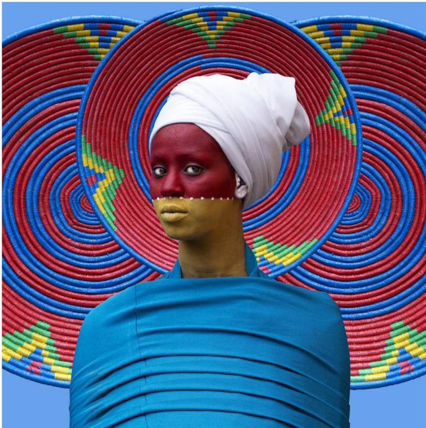
Aida Muluneh, City Life, 2016. Photograph Printed on Sunset Hot Press Rag 310. © Aida Muluneh

Du 14 avril au 30 juillet 2017, suivez les traces de l'histoire de l'Islam en Afrique de Zanzibar à Tombouctou, en passant par Dakar. L'Institut du monde arabe met à l'honneur des sociétés fortes de treize siècles d'échanges culturels et spirituels avec le Maghreb et le Moyen-Orient. Archéologie, architecture, patrimoine immatériel, art contemporain... : une première qui réunit près de 300 œuvres multidisciplinaires pour témoigner de la richesse artistique et culturelle de la pratique de l'Islam en Afrique subsaharienne. L'écriture devrait constituer le fil rouge de cette exposition qui confrontera le visiteur aux œuvres contemporaines majeures.