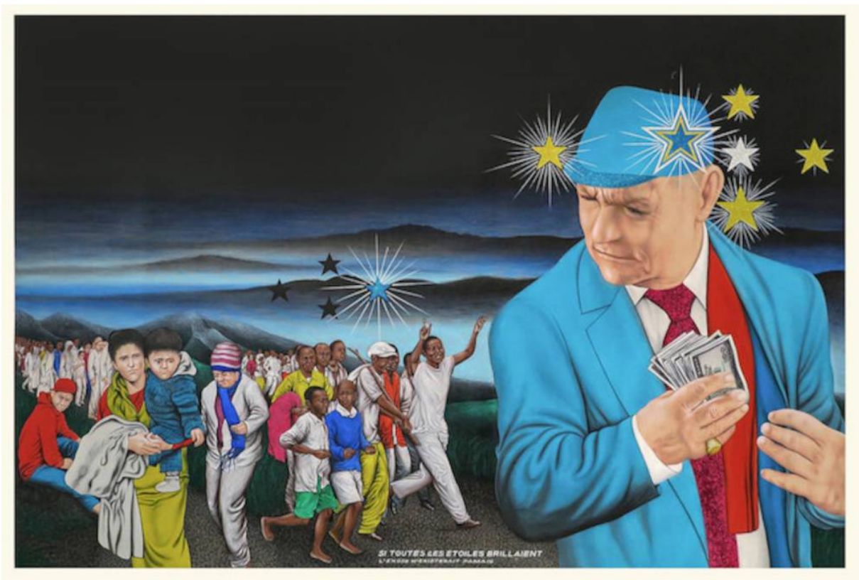
Chéri Samba Si toutes les étoiles brillaient , 2016 Peinture 135 x 200 cm Magnin-A, Paris © Chéri Samba