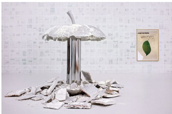
Franck Scurti – Le modèle, (La Quatrième Pomme, un hommage à Charles Fourier), 2011 – Sculpture en plâtre détruite, Inox. 200 x 200 cm

À lire, ci-dessous, le texte d'intention du commissaire.